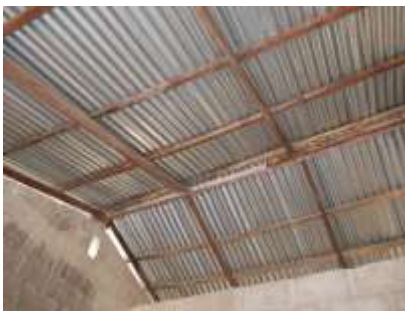
Luidruchtig : geen vals plafond