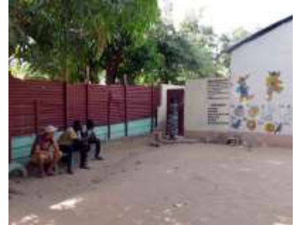
Omheinde speelplaats – Geen water