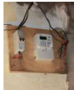
Drie kleine klasjes