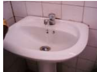
Er is terug water in de labo's !