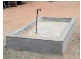
Bouw van een bassin met afvoer naar de nabije septische put