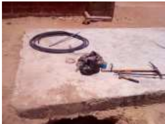
Aansluiting van de afvoer op de septische put