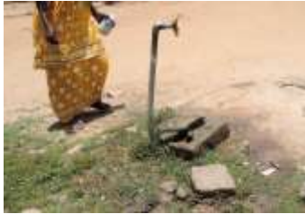
Bestaande kraan op het plein