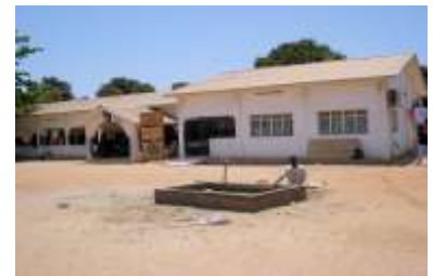
Leggen van de leidingen naar de diverse gebouwen