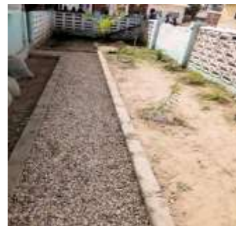
Het terras voor de materniteit werd voorzien van een waterpunt en een voetpad naar de mannenzaal.